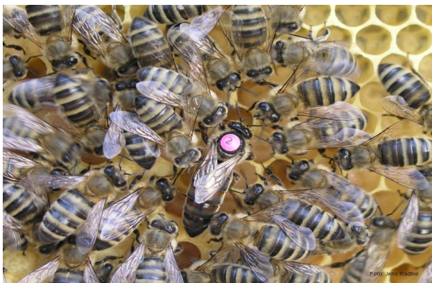
Königin mit Hofstaat

erforderl. Ausstattung: Raum mit Beamer; Möglichkeit, Anschauungsmat. auszulegen/zu -hängen